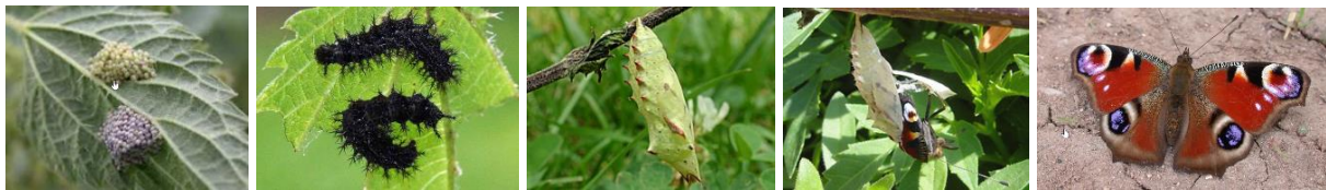
Entwicklung Tagpfauenauge von der Eiablage bis zum Schmetterling.

Im Raupenstadium häuten sie sich je nach Art drei bis achtmal. Das Raupenstadium dauert in der Regel zwei bis vier Wochen. Bei Überwinterung mehrere Monate. Man unterscheidet zwischen Hänge- oder Sturzpuppen.