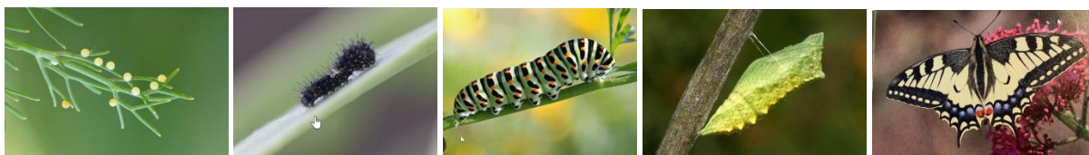
Entwicklung Schwalbenschwanz von der Eiablage bis zum Schmetterling.

Die Raupen hängen sich mit dem letzten Beinpaar frei baumelnd in ein Gespinstpolster, das mit der Unterlage befestigt ist.