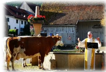
Vieh- und Brunnensegnung, 2025