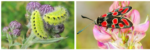
Esparsetten Widderchen Raupe und Falter

In der Schweiz leben 3'700 Schmetterlingsarten, davon 212 Tagfalter und 27 Widderchen. Die grosse Mehrheit sind Nachtfalter und Motten.