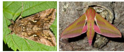
Gammaeule und Weinschwärmer (Nachtfalter)

Die meisten Tagfalter leben 3-5 Wochen. Einige überwintern als Falter (Zitronenfalter, Tagpfauenauge, kleiner Fuchs usw.) und können fast ein Jahr alt werden. Viele Arten produzieren mehr als eine Eiablage im Jahr.